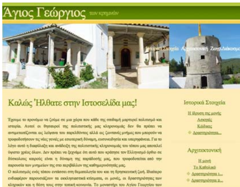
Εικ. 1: Η αρχική σελίδα της εφαρμογής

Ο παιδαγωγικός σχεδιασμός του εκπαιδευτικού «Η Μονή του Αγ. Γεωργίου» δίνει έμφαση στην εξοικείωση των μαθητών με το εκπαιδευτικό υλικό ως αφετηρία για δραστηριότητες που διαμορφώνουν τις προϋποθέσεις ενός πρώτου σταδίου ενσυναισθητικής προσέγγισης του μοναστηριού που μελετάται. Η ενσυναίσθηση ως διδακτική τεχνική, αποτελεί ένα μέσο «μεταφοράς» των μαθητών στις νοοτροπίες και τα χωροχρονικά δεδομένα μιας άλλης εποχής και βοηθά στην κατανόηση των καθημερινών προβλημάτων, αλλά και των σχέσεων με το περιβάλλον των παλαιότερων κατοίκων, που αντανακλώνται και στη σημερινή εποχή (Γραϊκός 2005). Παράλληλα το περιεχόμενο της εφαρμογής αναπτύχθηκε με βάση την υπερκειμενική δομή του παγκόσμιου ιστού αξιοποιώντας κατ' αυτόν τον τρόπο τις δυνατότητες του διαδικτύου για: α) πρόσβαση σε σύγχρονα εργαλεία πληροφόρησης λόγω της υποστήριξης πολλαπλών επιλογών αποθήκευσης και απεικόνισης, της παροχής απλής αλλά συγχρόνως ισχυρής φόρμας δημοσίευσης και της ενσωμάτωσης πολλαπλών μέσων (Αβούρης, 2000) και β) χρησιμοποίηση της υπερμεσικής τεχνολογίας που επιτρέπει στο μαθητή να προσεγγίζει και να επεξεργάζεται τη γνώση ολιστικά, με ποικίλους συνδυασμούς και δυνατότητες.